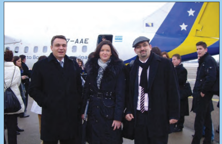
Dobro raspoloženje tokom putovanja

Štefan Füle, komesar za proširenje i politiku evropskog susjedstva pri Evropskoj komisiji je u svom govoru pohvalio vlasti Albanije i Bosne i Hercegovine za postignuti napredak, ali i pojasnio da se na ovome posao ne završava. Postoje