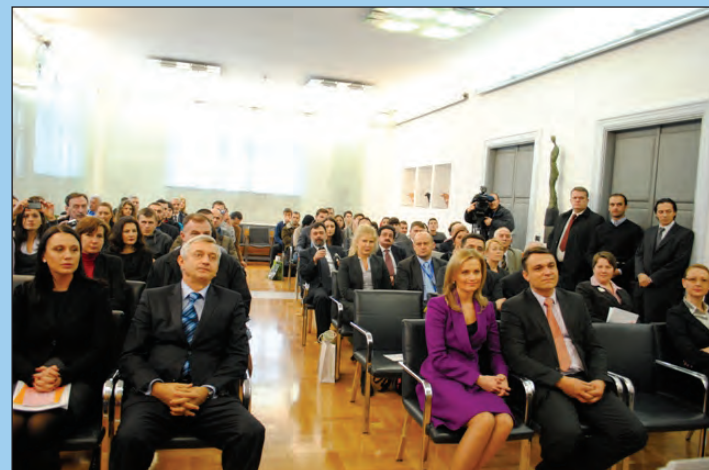
Upriličeni su brojni sastanci