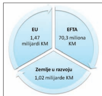
Izvoz po grupacijama zemalja (januar – april 2011.)