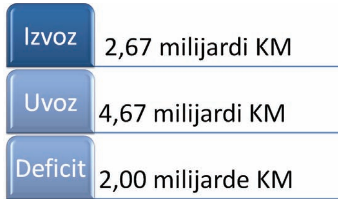
Vanjskotrgovinska razmjena BiH sa svijetom za period januar – april 2011.

Dva SSP-a su trenutno na snazi: s Bivšom Jugoslavenskom Republikom Makedonijom (stu-