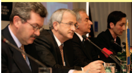
Otvoren novi Euro info korespondentni centar za razvoj biznisa