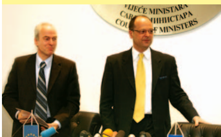
Pregovori o SSP - Prva tehnička runda