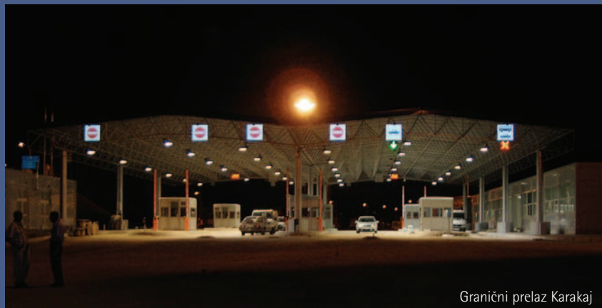
Granični prelaz Karakaj