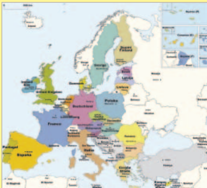
Države članice EU Zemlje kandidati Zemlje potencijalni kandidati