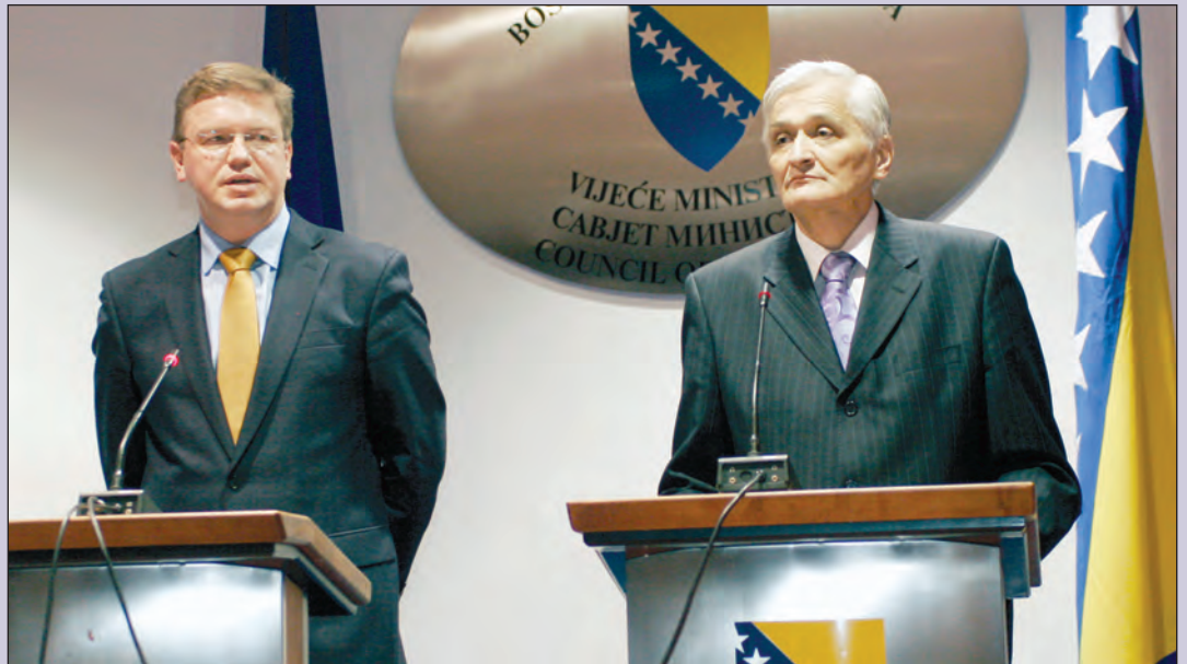
Štefan Füle i Nikola Špirić

Komesar Füle je naglasio da je u razgovorima sa predsjedavajućim Špirićem postignut visok stepen saglasnosti o većini pitanja, te da je upoznao