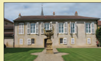
Kuća Roberta Schumana

Evropska unija pokrenula je novu inicijativu kojom želi promovirati mjesta koja imaju ulogu u zajedničkoj kulturi i povijesti moderne Evrope. Novi plan o uspostavi Evropske oznake baštine temelji se na inicijativi iz 2006., kojoj se tada priključilo 17 zemalja EU-a i Švicarska. Prema toj postojećoj shemi, 64 mjesta u 18 zemalja dobilo je evropsku oznaku nakon što su ih kandidirale vlade zemalja sudionica. Oznaku su, primjerice, dobili poljsko brodogradilište Gdansk, kao mjesto gdje je rođena Solidarność, prvi nezavisni sindikat u zemaljama Varšavskog pakta, kao i kuća Roberta Schumana, Francuza kojeg se smatra jednim od utemeljitelja današnje EU. Novi plan bit će dat na usvajanje Evropskom parlamentu i Vijeću i ako ga oni odobre, mogao bi stupiti na snagu 2011. ili 2012. godine.