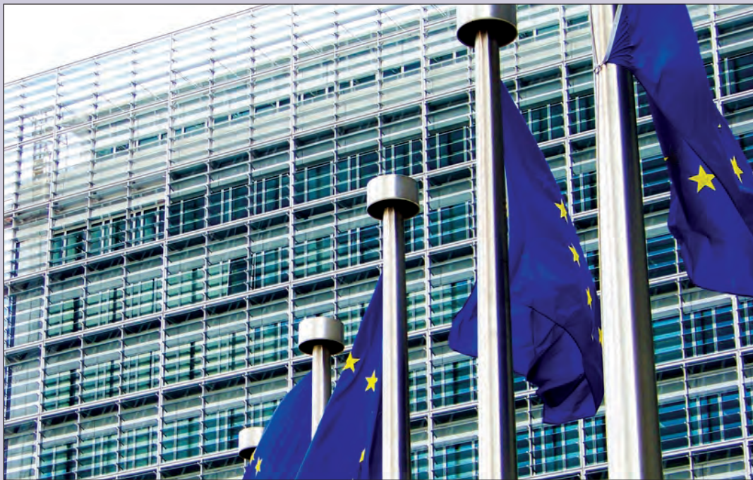
Sjedište Evropske komisije u Briselu

Kako bi postigao svoje ciljeve, plan Evropa 2020. sastoji se od niza važnih inicijativa