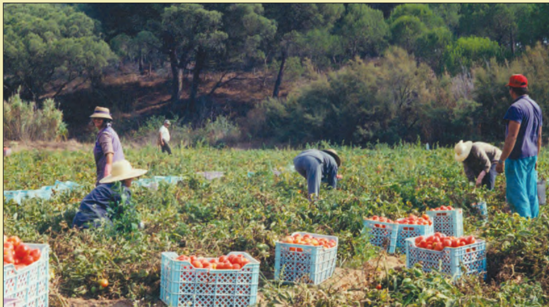
Udio troškova za poljoprivredu od početka zajedničke poljoprivredne politike stalno se smanjivao

Mnogim poljoprivrednicima koji obrađuju manje površine evropske subvencije služe za preživljavanje, ali zato velika, komercijalna poljoprivredna imanja dobivaju i više od 500.000 eura na godinu, što uzrokuje nezadovoljstvo mnogih. Povjerenik Ciolos je rekao da će promjene u zajedničkoj poljoprivrednoj politici morati uzeti obzir promjene nastale proširenjem EU-a. Komisija će uvažiti doprinos sudionika javne rasprave u dokumentu koji priprema za kraj ove godine a sa zakonodavnim prijedlozima će izići polovinom 2011. godine.