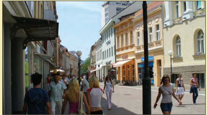
Banja Luka je bila domaćin predstavnicima Evropske komisije

Evropska komisija je pozdravila napredak BiH u preuzimanju Direktiva novog pristupa. Neka od otvorenih pitanja u oblasti akreditacije, mjeriteljstva i ocjenjivanja usaglašenosti treba da se riješe što prije kako bi ojačala konkurentnost industrije BiH. Evropska komisija je pozdravila jačanje administrativnih kapaciteta u ovom području, te naglasila da industrijska politika treba da bude dio Razvojne strategije BiH, što je jedan od prioriteta Evropskog partnerstva, te istakla važnost uspostavljanja sveobuhvatne strategije turizma širom zemlje koja bi bila korisna i malim i srednjim preduzećima. Osim toga, pozdravila je usvajanje Strategije za razvoj malih i srednjih preduzeća, ali je naglasila važnost potpune provedbe Strategije i usvajanja Zakona o promociji malih i srednjih preduzeća u BiH. Evropska komisija je podsjetila na kašnjenje u provedbi Strategije, u osnivanju Agencije za po-