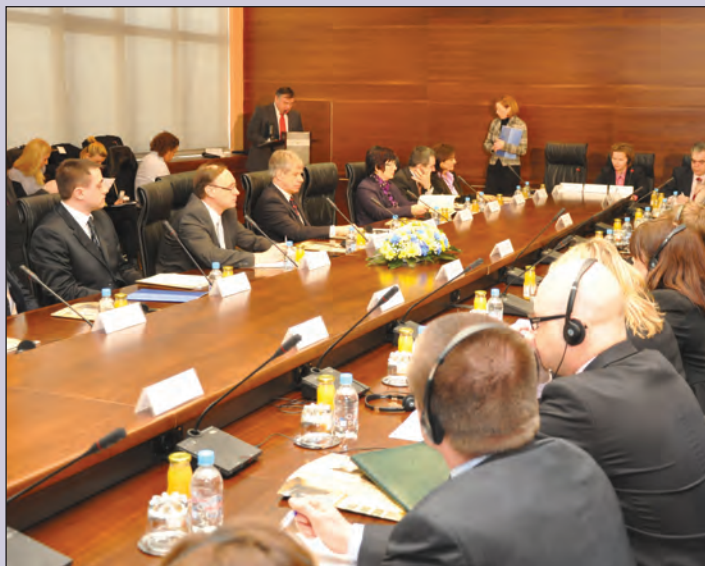
EU je obezbijedila jedan milion eura za ovaj program

Ovaj novi projekat je nastavak programa procjene potreba Centralne banke BiH koji je Evropska centralna banka, uz finansijsku podršku Evropske komisije, realizovala 2007. godine. Kemal Kozarić, guverner Centralne banke BiH, kazao je da je tada izvršena procjena stanja u sedam oblasti rada Centralne banke BiH, te obavljeno poređenje sa standardima evropskog sistema centralnih banaka. Na osnovu toga, Centralna banka BiH je dobila “Mapu puta”, odnosno preporuke koje je trebala provesti kako bi uskladila svoje aktivnosti sa evropskim standardima. Kako je istakao gospodin Kozarić, dio preporuka koje su date, Centralna banka BiH je provela vlastitim kapacitetima.