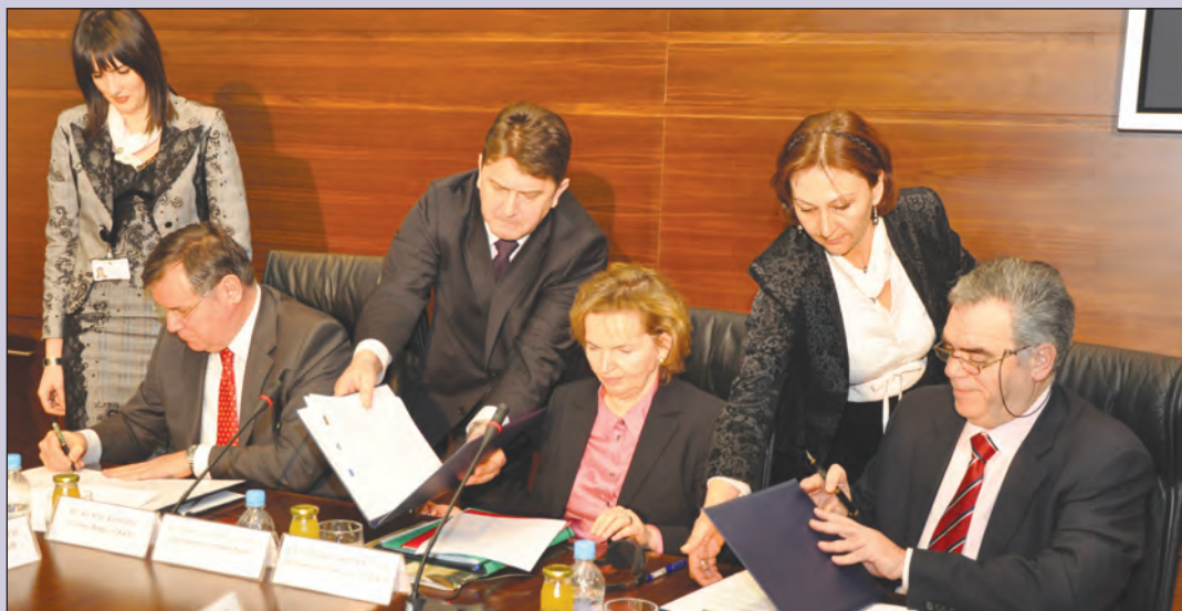
Protokol potpisali Kemal Kozarić, Gertrude Tumpel-Gugerell i Dimitris Kourkoulas

Gertrude Tumpel-Gugerell je naglasila da težnja Bosne i Hercegovine da se pridruži Evropskoj uniji i njen status kao potencijalne zemlje kandidat-