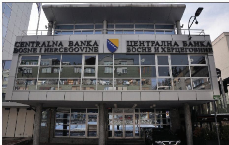
Centralna banka BiH (CBBH) jedan je od najznačajnijih uspjeha u zemlji nakon rata