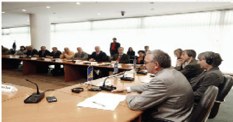
Projekat Jačanja lokalne demokratije (LOD) provodi se u 29 općina u cijeloj BiH

Temeljna pretpostavka je da dijalog između građana i njihovih općina - na duži rok – može poboljšati kvalitet pružanja usluga građanima.