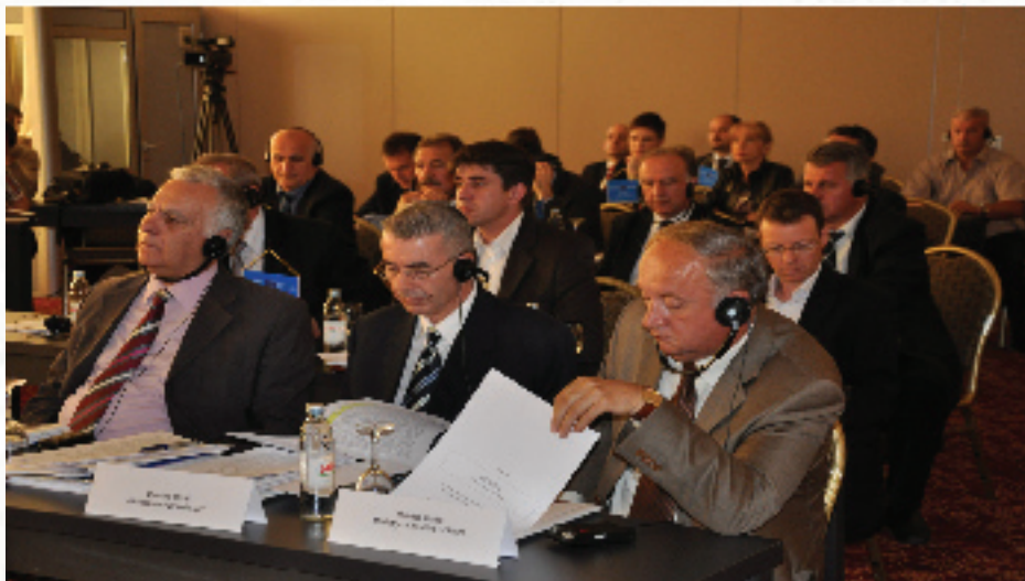
Više od 420 uposlenih u zatvorima prošlo je obuku u oblasti ljudskih prava

Projekt efikasnog zatvorskog menadžmenta poboljšao je svakodnevne operacije u bh. zatvorima i tretman zatvorenika. Također je pomogao ministarstvima pravde da revidiraju politike i zakonske okvire povezane sa zatvorima.