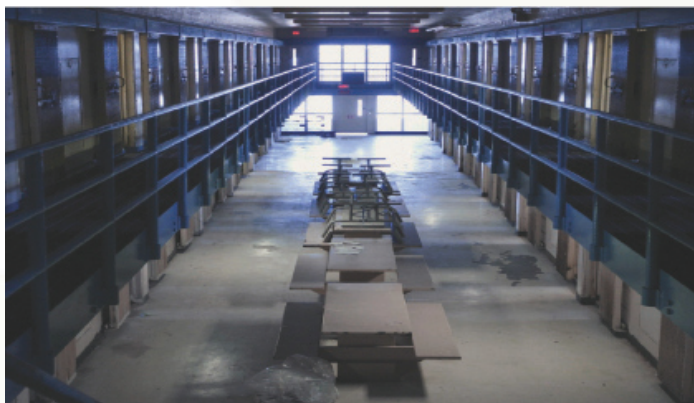
Projekt efikasnog zatvorskog menadžmenta poboljšao je svakodnevne operacije u bh. zatvorima i tretman zatvorenika