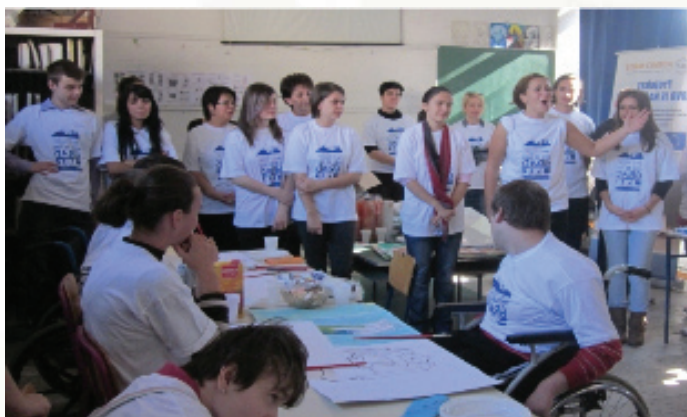
Lokalne vlasti trebaju uspostaviti dijalog sa organizacijama civilnog društva

Uz podršku IPA fondova u vrijednosti od tri miliona eura, od novembra 2008. do marta 2012. godine traje projekt Jačanje lokalne demokratije (LOD) koji se provodi u 29 općina u cijeloj Bosni i Hercegovini. Projekt implementira Razvojni program Ujedinjenih naroda (UNDP), u partnerstvu s općinama i organizacijama civilnog društva (OCD) te entitetskim udruženjima općina i gradova, kao i u bliskoj saradnji sa Direkcijom za evropske integracije. Projekt je usmjeren na podsticanje lokalnih vlasti da se na smislen način sa lokalnim akterima uključe u uspostavljanje radnog dijaloga s organizacijama civilnog društva.