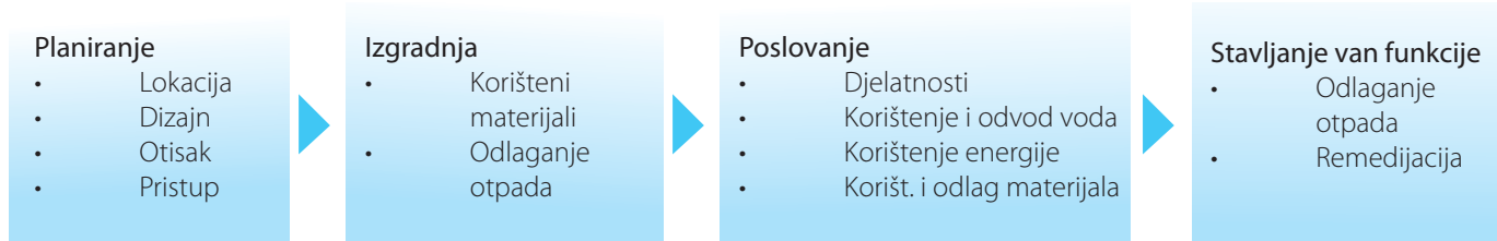
Slika 1: Životni ciklus pitanja djelovanja turističkih djelatnosti na okoliš

Radi utvrđivanja načina na koji neko konkretno turističko preduzeće ostvaruje utjecaj na prirodni svijet, neophodno je da se ispituju svi aspekti poslovanja tokom životnog ciklusa jednog takvog preduzeća. Turizam može imati i niz negativnih utjecaja na biodiverzitet, naročito kada se realizira bez standarda menadžmenta osmišljenih radi zaštite prirodnih dobara, i to onako kako je u kratkim crtama prikazano na slici 1 u nastavku.