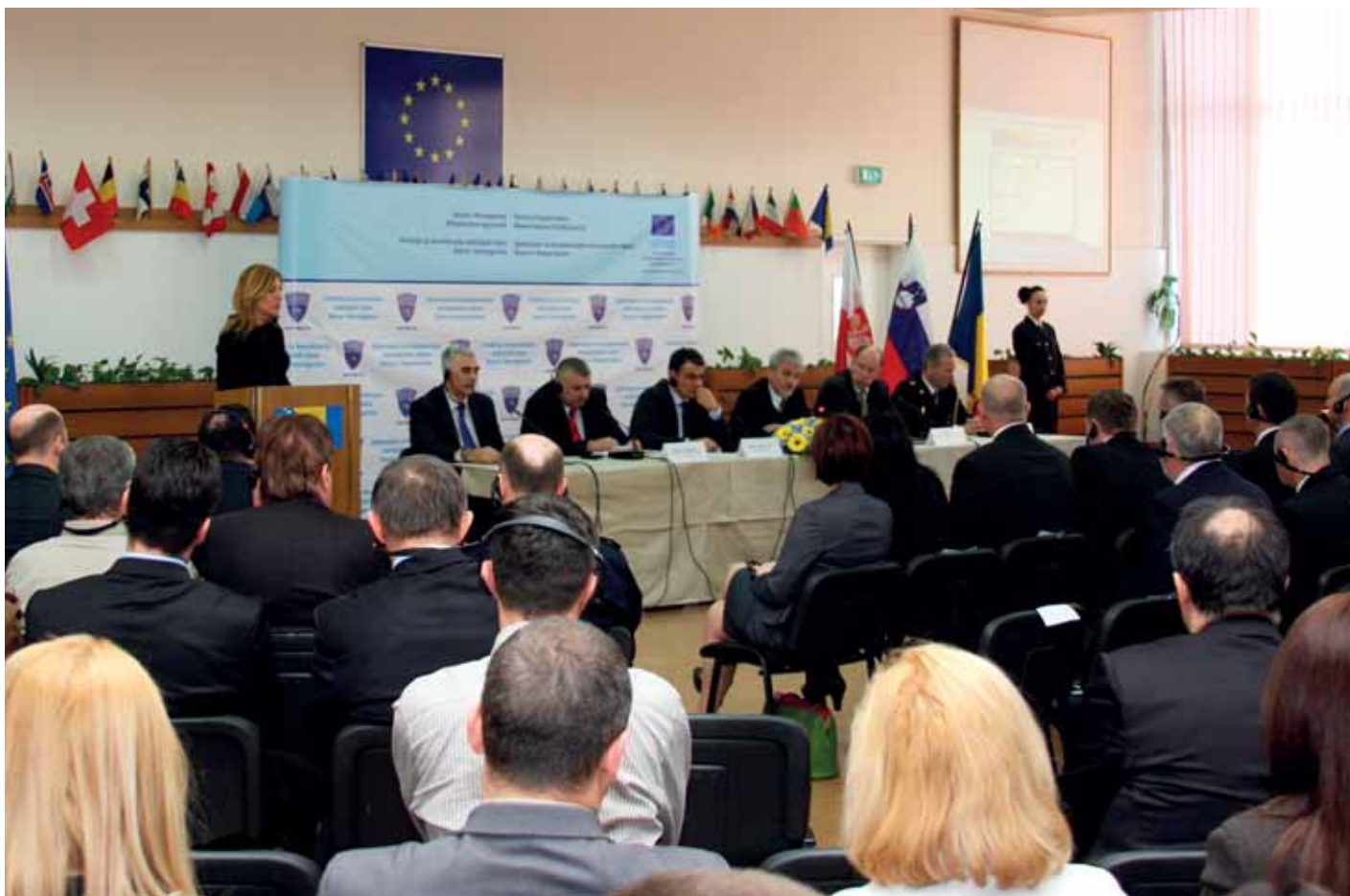
Ceremonija obilježavanja početka twinning projekta „Podrška Direkciji za koordinaciju policijskih tijela BiH“