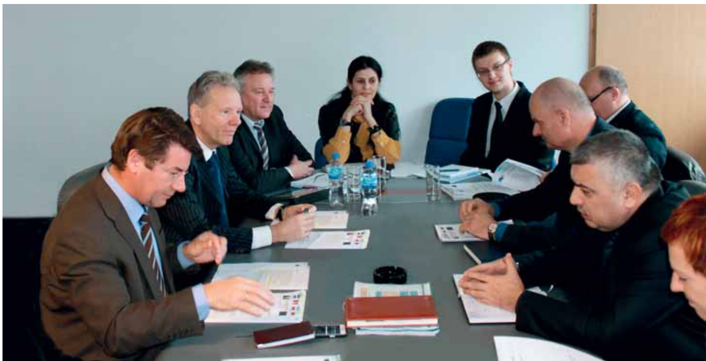
Sastanak Upravnog odbora twinning projekta