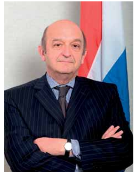
N.J.E. Jurriaan Kraak ambasador Kraljevine Holandije u Bosni i Hercegovini

Nadam se da će zahvaljujući daljnjim naporima Direkcije, ostalih relevantnih organizacija i političkih predstavnika pozitivni rezultati postignuti tokom implementacije twinning projekta biti održani i nadograđeni u interesu svih građana BiH. ■