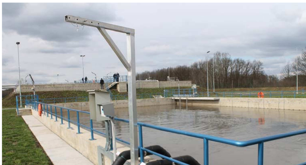
Postrojenje za tretman otpadnih voda u Bijeljini. EU je obezbijedila bespovratnu pomoć od preko 9 miliona eura za pripremu projekta i investicijske radove.

EU je tako pružila veliku podršku u cilju unapređenja svakodnevnog života građana Bosne i Hercegovine: