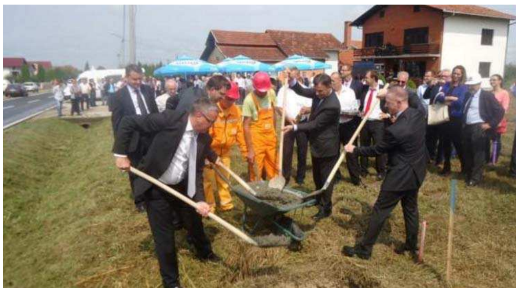
Postavljanje kamena temeljca za obilaznicu u Brčkom (septembar 2005). Radovi još traju. EU je obezbijedila 0,5 miliona eura za podršku provođenju projekta.

Pored toga, Bosna i Hercegovina imala je koristi od regionalnih projekata/inicijativa koje je finansirao WBIF kao što je Regionalni program energetske efikanosti za zapadni Balkan (REEP i REEP Plus) i Instrument za razvoj preduzetništva i inovacija na zapadnom Balkanu (EDIF).