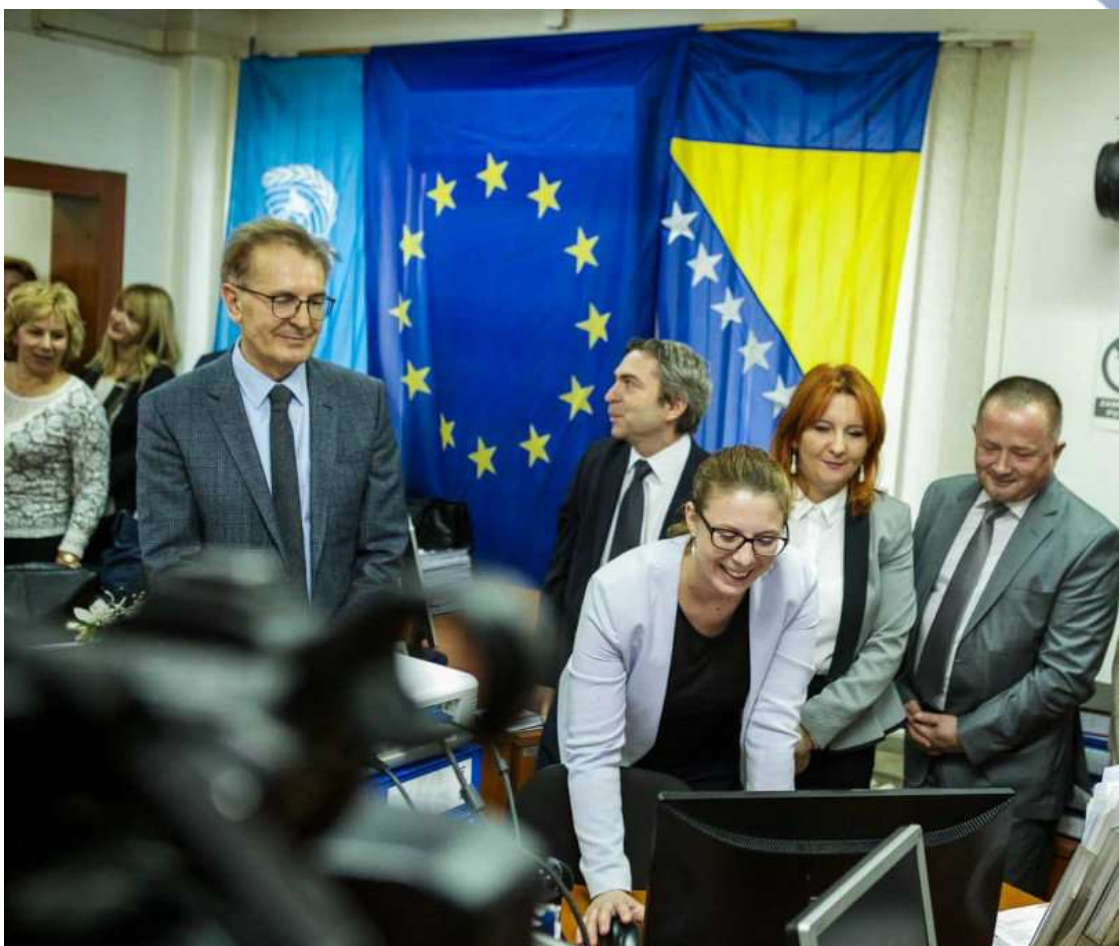
ASYCUDA++, pokrenuta je u decembru 2015. Godine u BiH

DELEGACIJA EVROPSKE UNIJE U BOSNI I HERCEGOVINI