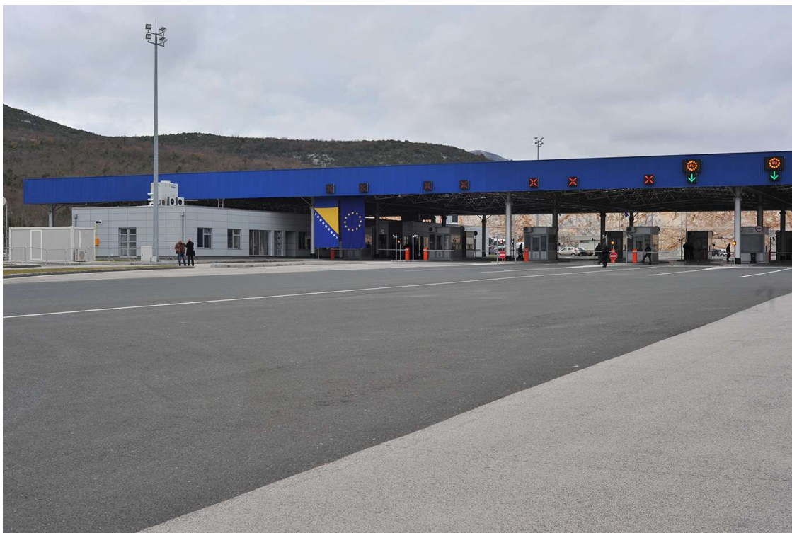
Granični prijelaz Bijača

„Aplikacije ASYCUDA pojednostavila je procedure i znatno je efikasnija od prethodnog rješenja. Vrlo smo zadovoljni ubrzavanjem procedure carinjenja. Jedini manji problem je zagušenje glavnih servera koje se događa s vremena na vrijeme“, rekao je Antunović.